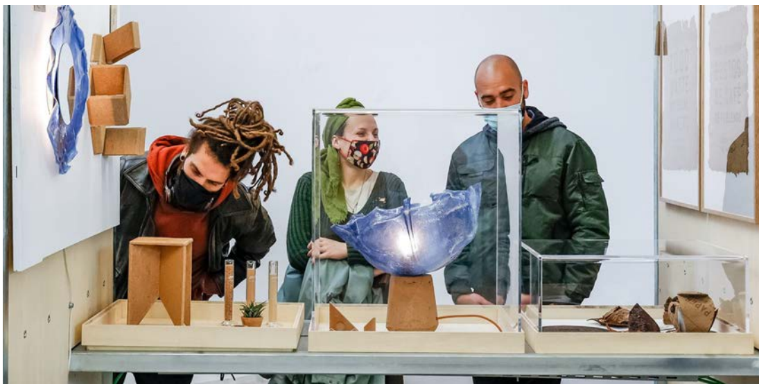
Des objets créés à partir de déchets alimentaires conçus par un fablab à Barcelone