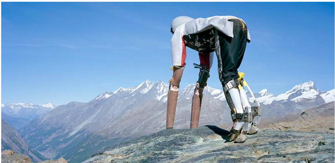
Goatman , Thomas Thwaites

L'installation Goatman présente dans l'exposition peut prêter à sourire. L'artiste Thomas Thwaites a détourné la technologie pour imiter la position et le mode de vie des chèvres. Derrière ce geste atypique se cache en réalité la volonté d'explorer une autre perception du monde .