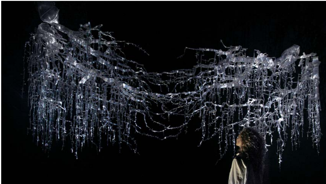
La communication entre les arbres par leurs racines transposée dans l'espace avec Econtinuum de Thijs Bierstecker.

l'activité des abeilles, rendant visible la part d'invisibilité de nos écosystèmes , pourtant si essentielle à notre survie.