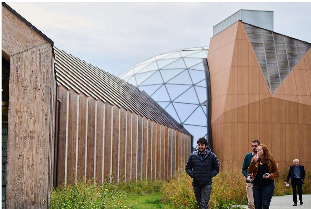
Le Pavillon

Le Pavillon est un centre d'exposition, d'expérimentation et d'innovations qui décloisonne les disciplines et s'empare simultanément d'arts, de sciences et de technologies pour explorer notre monde contemporain. Situé à Namur, aux pieds du téléphérique sur l'esplanade de la Citadelle, ce nouveau lieu immersif et expérimental à vocation pédagogique vous invite à découvrir sa nouvelle exposition : Biotopia .